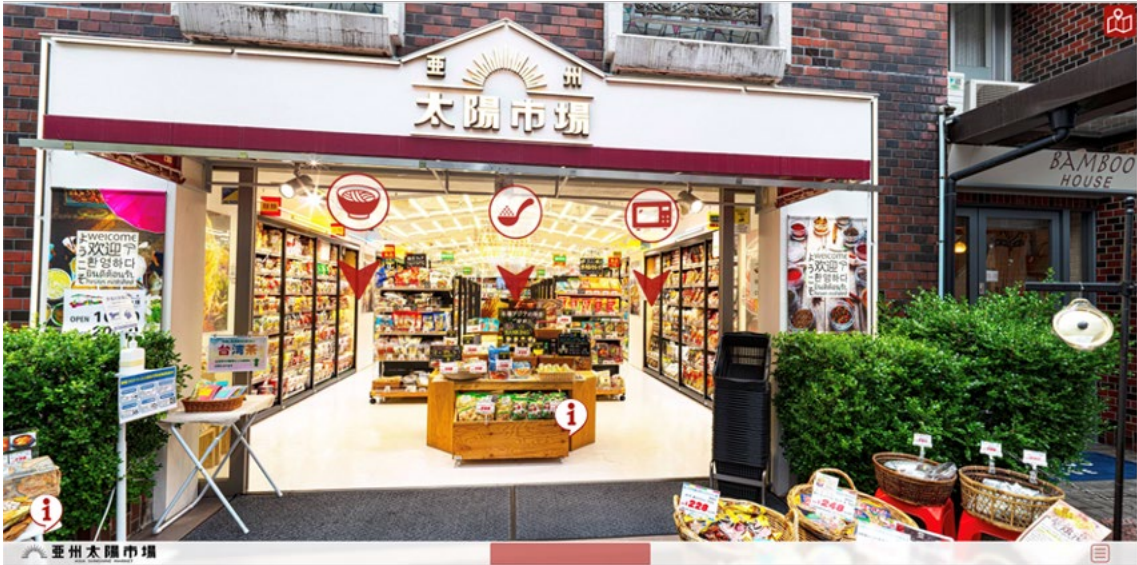
吉祥寺店（バーチャルストアバージョン）